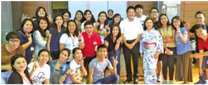
▲ フィリピンからの研修生の皆さまと

17日には、箱根にて党県本部の議員研修会へ。子供の貧困家庭への支援に尽力されるNPO代表の基調講演、太田国土交通大臣の講演など、有意義な研修となりました。22日には、介護施設での就業のため、金沢区内で研修を行っているフィリピンの若者の皆さまのもとへ。皆さまが無事に研修を修了できるよう願いをこめつつ、ご挨拶させて頂きました。