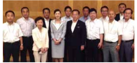
▲ 党・五大市政策研究会にて

議会休会中の8月は、新人議員の私にとっては、議員力を高める研修の季節。また、お祭りや盆踊り、市民相談など、多くの市民・区民の皆さまとの交流を深める貴重な期間でした。5日、6日には神戸・大阪・京都・名古屋の公明党市議団の代表の皆さまを横浜に迎え、政策研究会を開催。生活困窮者自立支援や大都市制度の取組について、意見交換を行いました。