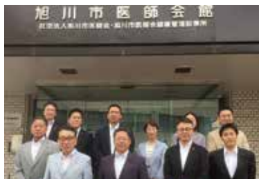
▲旭川市医師会館にて委員会メンバーで

午後からは旭川市へ。医師会が運用する病院間での患者情報共有システムである「たいせつ安心i(アイ)ネット」について視察。質の高い診療に寄与し、かかりつけ医療体制を後押しする、大変に有意義な仕組み。ぜひ横浜市でも導入したいと思いました。