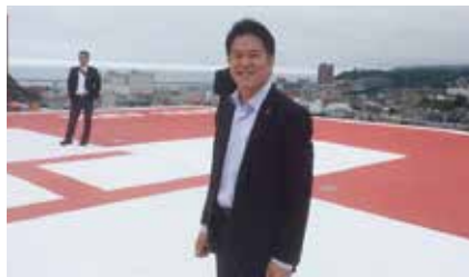
▲小樽市立病院屋上のヘリポートにて

小樽市では市立病院の統合再整備について。最新設備のチェックとともに、課題などを聴取。「患者に選ばれる病院であるために、医者に選ばれる病院でなくてはならない」と、人材確保に関する取り組みも伺いました。