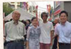
▲7月1日 能見台駅前・七夕まつり