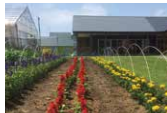
▲「ペコペコのはたけ」外観

最終日は、当別町の社会福祉法人ゆうゆうへ。「過疎地域で福祉の新たな価値観を創造」との理念のもと、町内で就労・自立支援、放課後デイサービスなどを幅広く展開。訪問した「ペコペコのはたけ」では、障害のある方による野菜栽培、食堂運営を行っていますが、プロの監修のもと、高い品質で提供されており大人気。地域の活性化にも寄与している、幾重にも有意義な取組です。