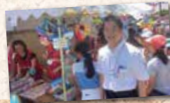
◀7月15日 六浦・睦地域にて