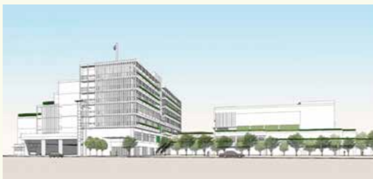
▲全体完成イメージ

平成31年2月のオープンを目指し、公会堂・駐車場棟および泥亀公園の工事を進めています。