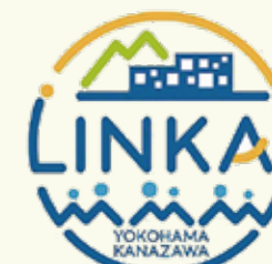
▲LINKAI横浜金沢のロゴマーク

昨年3月に策定された活性化プランをもとに、同地域を「LINKAI横浜金沢」とネーミング。30年度は、地域の魅力を内外に発信する、プロモーション活動などを展開。域内のイメージ向上や就労人口の増加を目指します。