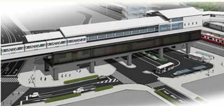
▲新駅舎完成イメージ

30年度中にシーサイドラインの新駅舎の完成、東西自由通路も含め年度末までの一部供用開始を目指し、急ピッチで工事を進めています。京急線の駅舎改良工事に合わせて、ホームドアの設置についても要望して参ります。