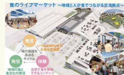
▲事業者による提案概要書より(イメージ)

31年度の開業に向け、民間事業者による賑わい施設の着工、整備の促進とともに、国道交差点改良・道路整備工事を進め渋滞緩和策を講じます。また、関連棟のバリアフリー化や施設の安全性を高める改修を行います。