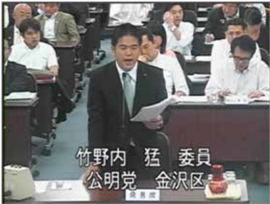
▲ 横浜市会ホームページ中継画面より

決算第二特別委員会にて、10月5日の資源循環局の審査では、廃棄物最終処分場の効果的な延命の推進、高齢化社会に対応したゴミ収集のあり方の展望などについて、6日の市民局では、高齢者の健康づくりのためのスポーツ振興、自治会・町内会の活性化などについて、質問を行いました。各局の事業を精査・チェックし、評価や指摘を行うこと。これも議会の大事な役割です。