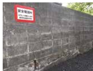
▲金沢中学校外周のブロック塀

*文庫小学校、六浦小学校、能見台小学校、金沢中学校、西柴中学校、六浦中学校、金沢高校