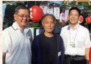
▲7月29日 堀口町内にて