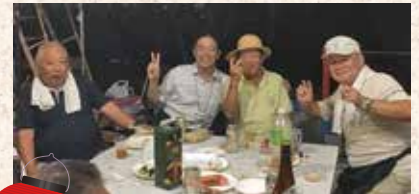
▲8月5日 並木1丁目にて