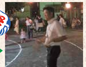
8月3日▶ 南川町内にて