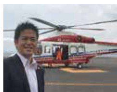
▲金沢区にある横浜ヘリポートから出発

7月27日、基地対策特別委員会の市内視察はヘリコプターにて、市内の米軍基地と跡地を20分でひと巡り。上空から見ると基地が市街地に近接していることが良く分かります。米軍による事