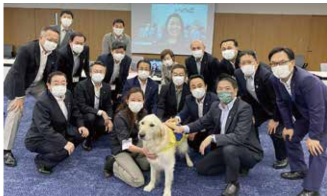
▲日本介助犬協会との政策懇談会には介助犬のハッシュ君も参加

6月14日から18日まで、市内42団体と公明党市議団による政策懇談を開催。昨年はコロナ禍につき書面での開催でしたが、今年は感染対策を行いながら対面で実施。施策の充実へ、活発な意見交換を行いました。