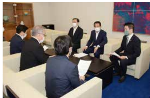
▲副市長、教育長らに中長期的な対応を含めた安全対策を申入れ(5月28日)

小学校児童が犠牲になった京急富岡駅前の通学路での痛ましい事故を受け、議会質疑に重ねて、緊急要望。子どもたちの心のケア、地元の皆さまの要望を踏まえた迅速な対策と合わせて、中長期的なまちづくりの観点からの対策検討を求め、市長、副市長、教育長、道路局長からそれぞれ迅速な対策を実施する旨の回答