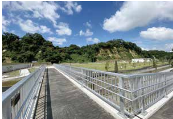
▲並木わくわく橋から園内を望む