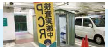
▲フィットケアデポ富岡西店では 地下駐車場に臨時検査所を設置