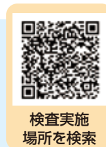
検査実施 場所を検索