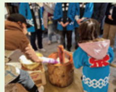
▲富岡西部町内会の餅つき