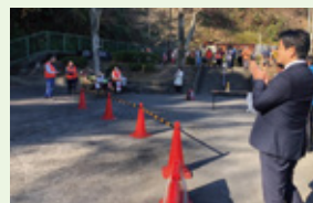
▲高舟台自治会の「どんど焼き」