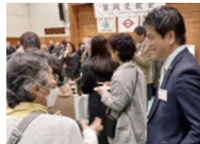
▲6日 金沢シーサイドタウン連合自治会 賀詞交歓会