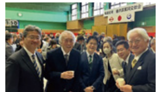
▲5日 金沢区賀詞交歓会