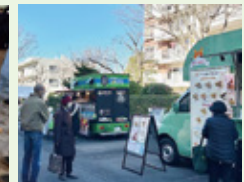
▲ブラウンハイム冬季交流会