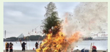
▲海の公園で「どんど焼き」