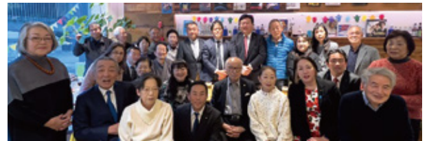
▲15日 横浜金沢文化協会 新年会