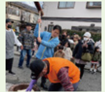
▲大道町内会の餅つき