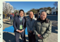
▲瀬ヶ崎西部町内会の餅つき

区内各地で餅つき、どんど焼きなど賑やかな集いが開催。地域の皆さまの輪に加わり、楽しい交流をさせて頂きました。