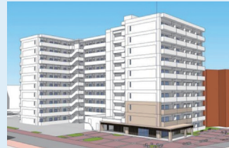
▲新・瀬戸橋住宅の完成イメージ