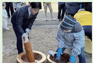
▲1月26日、富岡第二地区の餅つき大会へ

1月～2月は各地域で新春のイベント。寒風の中、多くの皆さまが集い、暖かで賑やかな交流が行われました。