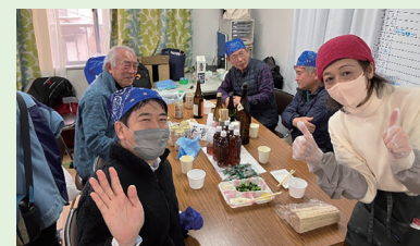
1月21日、地元・富岡事務所のお隣の桜ヶ丘町内会の餅つき大会をお手伝い