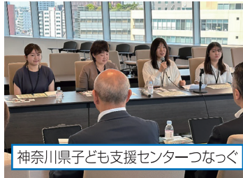
神奈川県子ども支援センターつなぐ