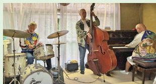
▲釜利谷ふれあいカフェでジャズライブ(10月5日)