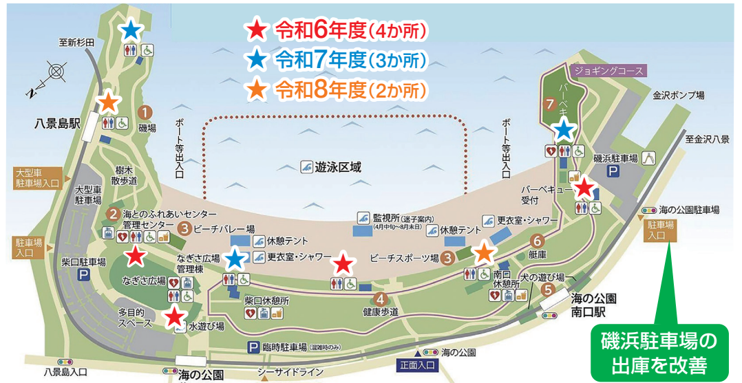
《トイレの洋式化、リフレッシュ化を3か年で実施!》

レストハウスの早期整備に加え、第二期エリアの整備に際してドッグラン、スケボー・BMXパーク、映画撮影所、バスケットコート等、皆さまからリクエストのある施設整備についても検討するよう要望しました。