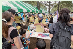
▲金沢まつりいきいきフェスタ(10月19日)

10月に入りようやく秋らしい陽気の下、金沢区内で和やかな地域の交流。私も各地へ伺い、皆さまと楽しいひと時を過ごしました。