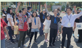
▲富岡第三地区スポーツフェスタ(10月13日)