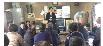
建替え事業の進捗等を報告▲ (2019年3月、旧瀬戸橋住宅の集会所)