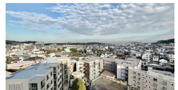
▲八景島・海の公園を望む絶景