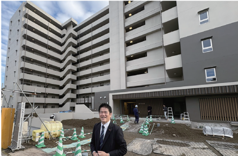
▲建築現場を視察(2024年11月11日)

2015年の市議員初当選直後から取り組んできた風呂なし市営住宅の課題。建替えの前倒し、仮住まいのための引越し等に係る住民の皆さまの負担軽減を実現。エレベーターなどのバリアフリー機能、断熱窓・LED照明などの環境性能、浴室・キッチン・洗面の3点給湯も備えた快適な市営住宅が完成し、いよいよ年明けから入居がスタートへ! 六浦・瀬ヶ崎住宅も、再生に向けた事業が順調に進捗しています。