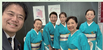
▲秀麗会神奈川県鶴見大会 (4月26日)