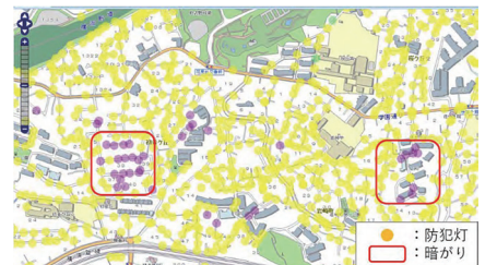
▲GISマップを活用して街の暗がりを把握