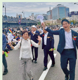
▲ザよこはまパレード (5月3日)