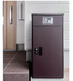
▲宅配ボックス(設置例)