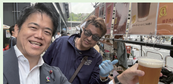
▲金沢八景コミュニティ マーケット (4月29日)