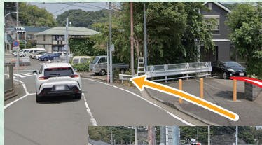
◀歩道が途切れて車道脇を歩く状態

歩道が交差点前で途切れ、子どもたちが車道を歩かざるを得ない状況を心配するお声を頂き、私も2018年から地域の皆さまと改善の要望を続けていましたが、5月13日から新たに完成した歩道が供用開始されました。子どもたちの安全が、大きく前進です！