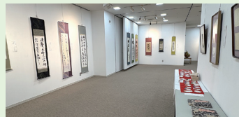
▲金沢区書道協会展 (5月9日)