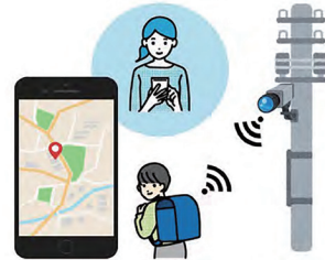
▲スマート防犯灯(イメージ)