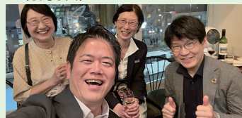
▲行政書士会金沢・磯子支部 懇親会 (5月15日)