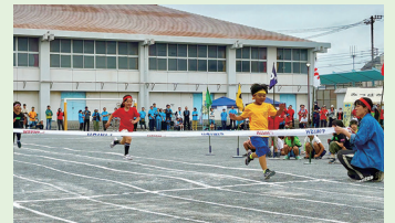
▲学童保育金沢ブロック運動会 (6月7日)