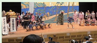
▲金澤の木遣と祭囃子の発表会 (5月30日)