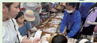
▲高谷町内会ふれあいフェスティバル(5月24日)