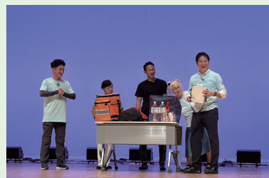
第8回金沢まごころフェスティバルには「絆の会」メンバーとして防災啓発の寸劇・ダンスで出演しました (6月14日)