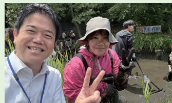
▲大道小学校「とんぼ池」の水抜き+清掃(6月6日)