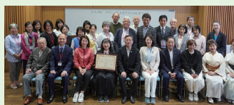
▲横浜金沢文化協会年次総会 (5月23日)