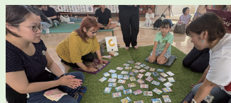
▲カナがる!公式大会 @富岡小(5月31日)